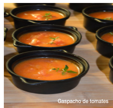
Gaspacho de tomates

(Chorizo ibérique, Jambon Serrano, Fuet de Vic, Terrine Grand-mère, Grana Padano, Pecorino affiné, Gressins Condiments : Câpres queues, tomates confites, artichauts confits, olives Kalamata)