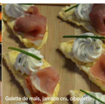
Galette de maïs, jambon cru, ciboulette