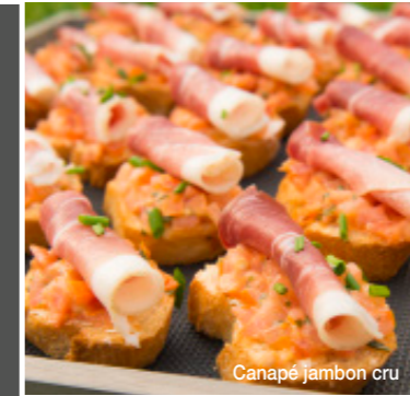
Canapé jambon cru