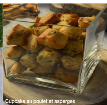
Cupcake au poulet et asperges