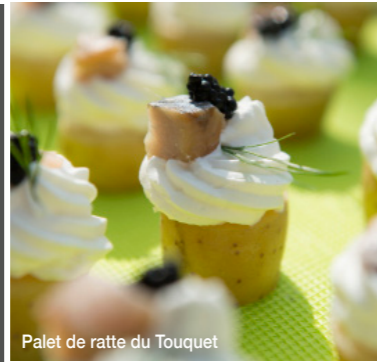
Palet de ratte du Touquet