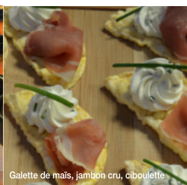
Galette de maïs, jambon cru, ciboulette