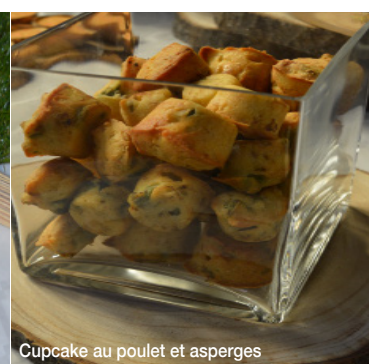
Cupcake au poulet et asperges