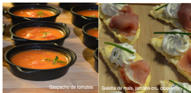
Gaspacho de tomates