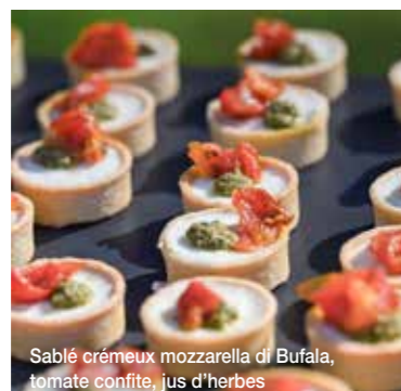
Sablé crémeux mozzarella di Bufala, tomate confite, jus d'herbes