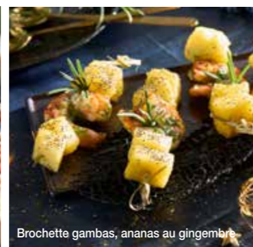
Brochette gambas, ananas au gingembre